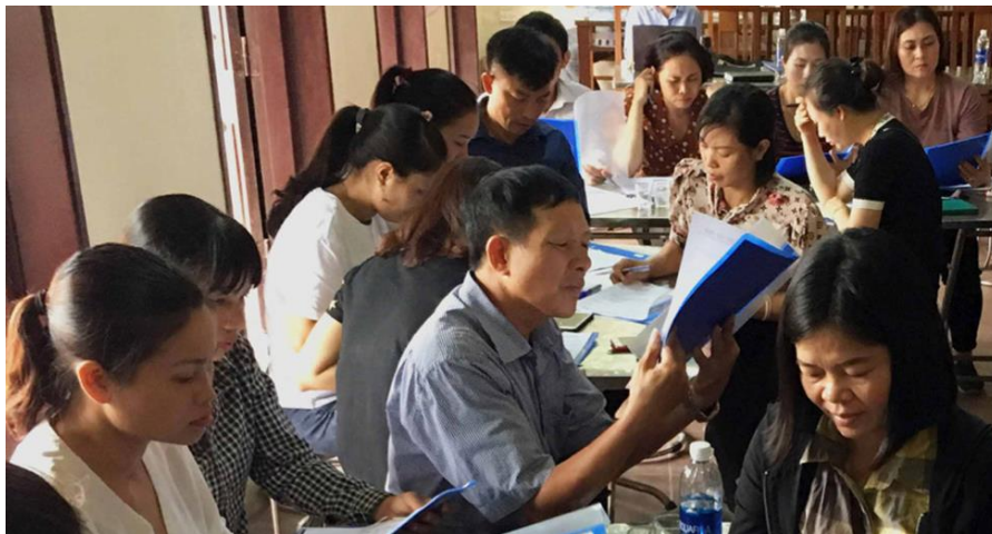
ภาพจากหมู่บ้าน Lien Ha ประเทศเวียดนาม

ดังนั้นจึงเป็นเรื่องสำคัญที่จะต้องมีการจัดการฝึกอบรมมุ่งเน้นไปที่การทำตลาด และการพัฒนาธุรกิจ การช่วยเหลือ MSMEs ควรรวมการวางแผนการทำธุรกิจที่ต่อเนื่อง มากไปกว่านั้น การช่วยเหลือ MSMEs ให้สามารถเข้าถึงแหล่งเงินทุนเป็นสิ่งสำคัญในการช่วยเหลือ MSMEs ให้ฟื้นตัวหลังจาก COVID-19 ให้สามารถประกอบกิจการได้อย่างถูกต้องถูกกฎหมาย และยั่งยืน และมากกว่านั้นยังต้องมีการเสริมสร้างความสามารถของสมาคมธุรกิจให้สามารถสร้างความตระหนักรู้ในนโยบายความเท่าเทียมทางเพศในสถานที่ทำงาน แก่สมาชิก เพื่อให้เกิดการพัฒนาในการปฏิบัติต่อแรงงาน พัฒนาความไม่เท่าเทียมกันของค่าแรงงานระหว่างหญิง-ชาย และความไม่เท่าเทียมกันในการเข้าถึงโอกาสการฝึกอบรมอาชีพ