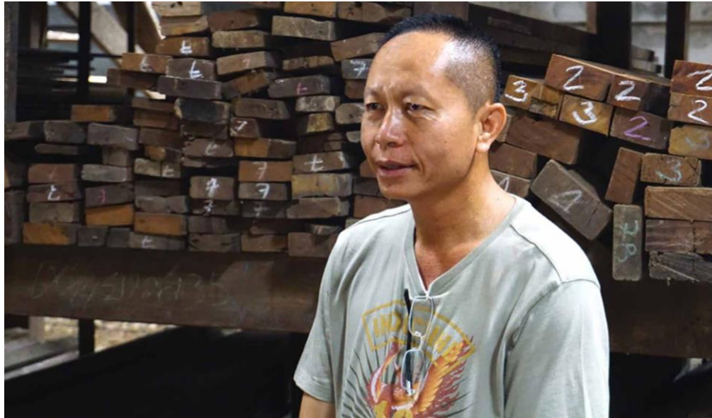
ภาพผู้ประกอบการไม้เก่าจากอำเภอบ้านธิ จังหวัดลำพูน